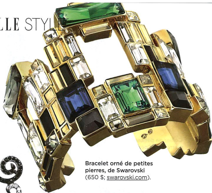
Bracelet orné de petites pierres, de Swarovski (650 $; swarovski.com ).