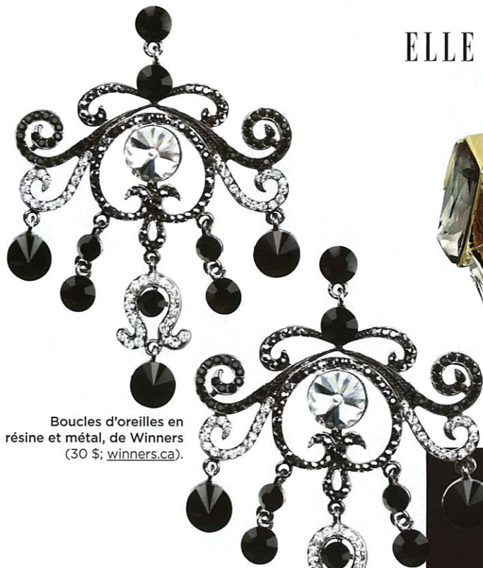
Boucles d'oreilles en résine et métal, de Winners (30 $; winners.ca ).