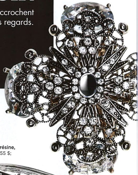
Broche en verre et métal, d'Expression (30 $; labaie.com ).