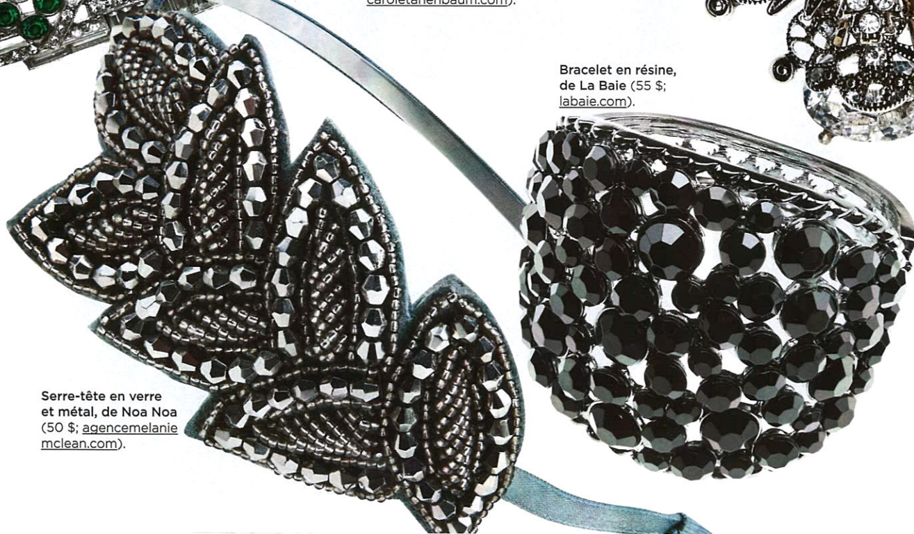
Serre-tête en verre et métal, de Noa Noa (50 $; agenceamelanieclean.com ).