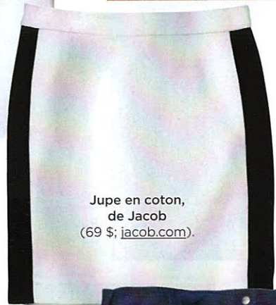
Jupe en coton, de Jacob (69 $; jacob.com ).