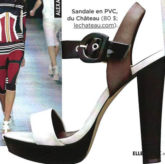
Sandale en PVC, du Château (80 $; lechateau.com ).

nos conseils Pantalon cargo, taille coulissée, nylon, maille, néoprène... Les créateurs ont décidé de sortir le sportswear du gym. L'idée, c'est de glamouriser des vêtements athlétiques en conjuguant, par exemple, un parka sport bien coupé et des sandales à talons hauts. Côté couleurs, on adopte des vêtements de base passepartout en noir, en blanc, ou une combinaison des deux, qu'on égaye d'un sac jaune canari ou d'un pull rouge feu. Le match de la saison!