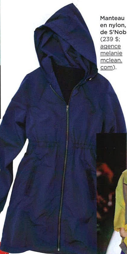
Manteau en nylon, de S'Nob (239 $; agence melanie mclean.com ).