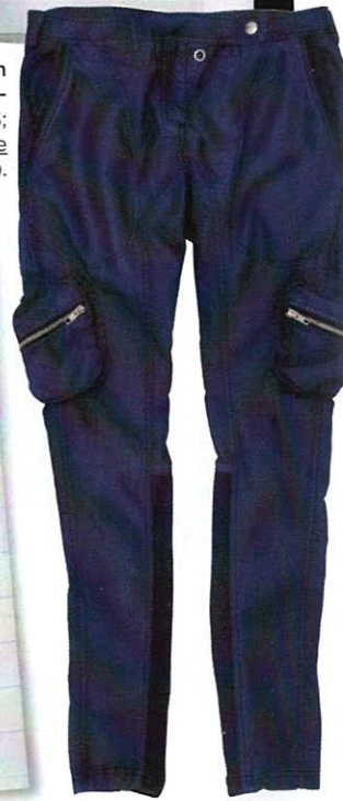
Pantalon en coton, de St-Martins (159 $; agencemelanie mclean.com ).