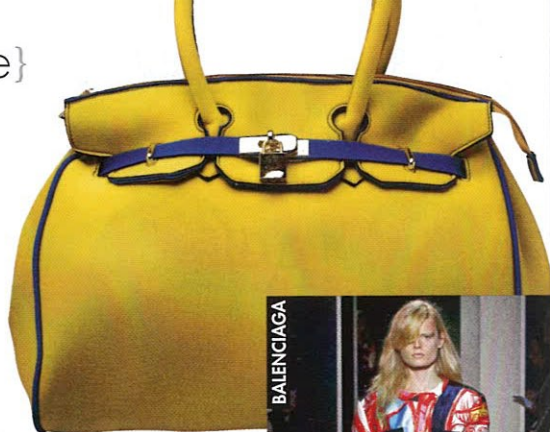
Sac en PVC, de The Shoe Company (60 $; theshoecompany.com ).