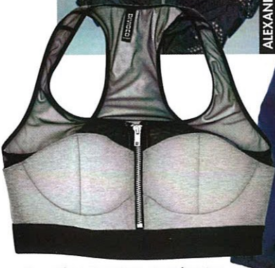
Brassière en coton et polyester, de H&M (20 $; hm.com ).