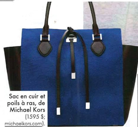
Sac en cuir et poils à ras, de Michael Kors (1595 $; michaelkors.com ).