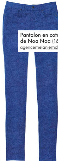
Pantalon en coton stretch, de Noa Noa (165 $; agencemelaniemclean.com ).