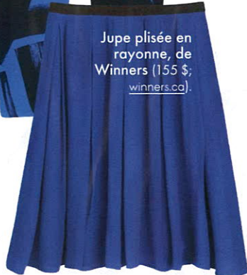
Jupe plisée en rayonne, de Winners (155 $; winners.ca ).