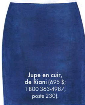
Jupe en cuir, de Riani (695 $; 1 800 363-4987, poste 230).