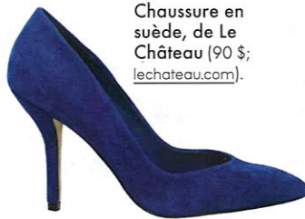
Chaussure en suède, de Le Château (90 $; lechateau.com ).