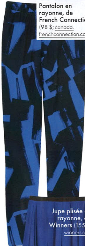
Pantalon en rayonne, de French Connection (98 $; canada.frenchconnection.com ).