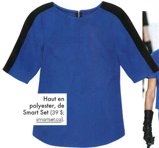
Haut en polyester, de Smart Set (39 $; smartset.ca ).