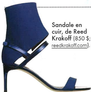
Sandale en cuir, de Reed Krakoff (850 $; reedkrakoff.com ).