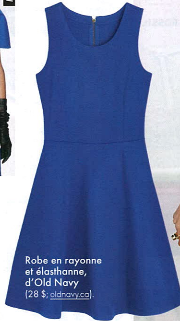
Robe en rayonne et élasthanne, d'Old Navy (28 $; oldnavy.ca ).